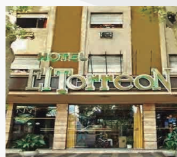
HOTEL EL TORREON